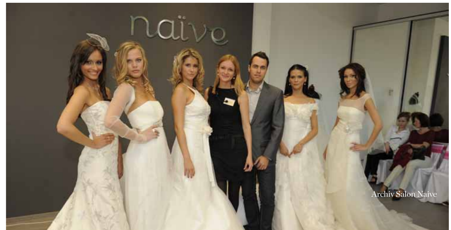
Archiv Salon Naive

né šaty s perím, ktoré napriek svojej extravagancii pôsobia veľmi elegantne a vkusne. Ak chcete vyzerieť ako nevesta, na ktorú sa nezabúda a famme fatale súčasne, tieto šaty pripomínajúce 30. roky v Amerike sú ako stvorené pre vás. ( http://www.svadobne-saty-naive.sk/svadobne-saty/novinka---salon-bratislava )